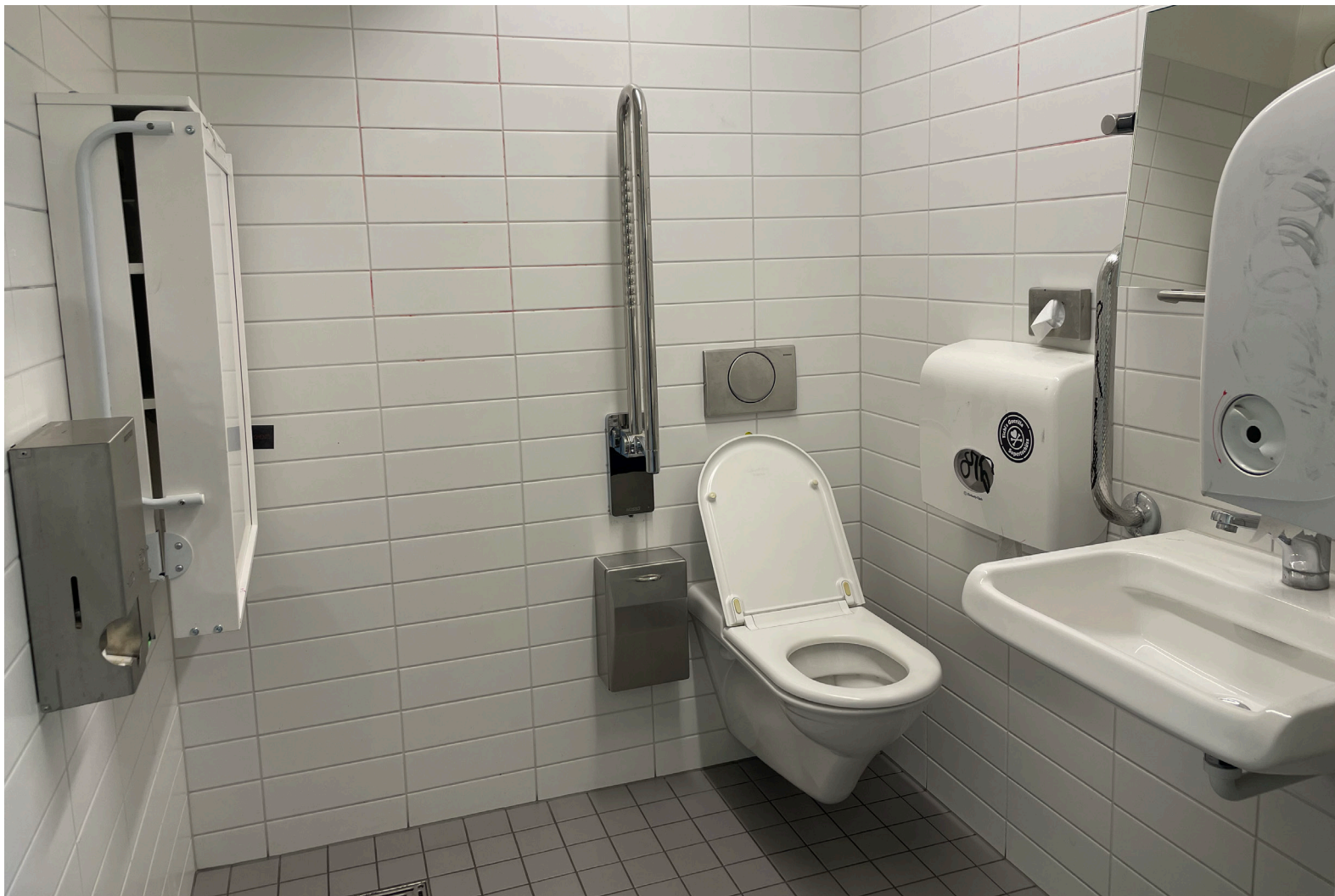
So sieht die barrierefreie Toilette von innen aus.